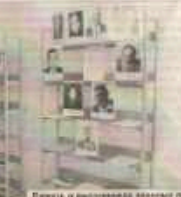
Выставка в школьном музее посвящена 100-летию Великой Отечественной войны.

Районная газета «Коношский Курьер» 01.09.2015