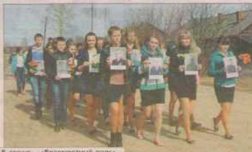
В строю – «Бессмертный полк».