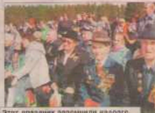
Этот праздник запомнили надолго.

Районная газета «Коношский Курьер» от 17.05.2013