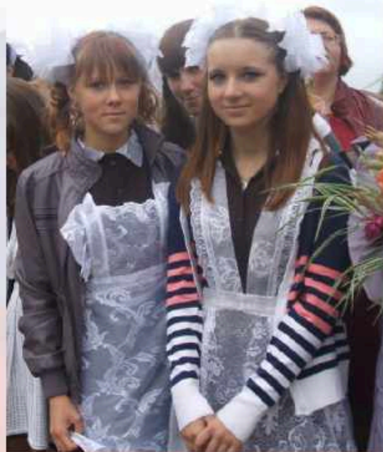
УЧАСТНИЦЫ ИССЛЕДОВАНИЯ – ПРОЕКТА «УЛИЦА ИМ.