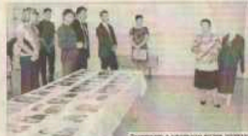
Выставка в школьном музее посвящена 100-летию Великой Отечественной войны.

В рамках проекта ребята создали памятные знаки, которые будут установлены в местах, связанных с историей района.